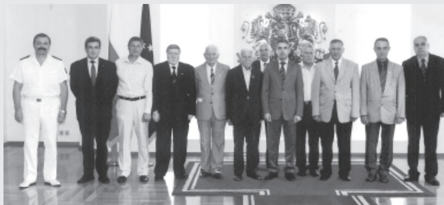
Участниците в първата среща с президента Росен Пленвелиев се снимаха в Гербовата зала.

ва. Според него военната униформа се е превърнала в работно облекло и вече е загубила значимостта си на символ на достойнство. Той постави с тревога въпроса за отношението на българите към националния ни флаг и припомни инициативата на военно-патриотичните съюзи за промяна на закона в тази насока.