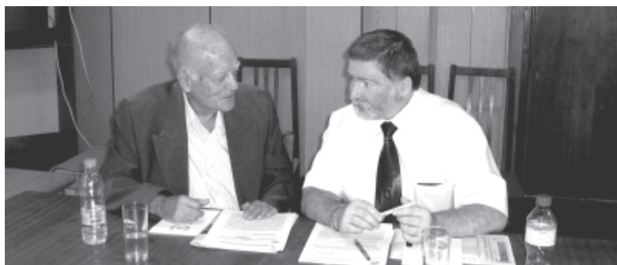
С председателя на СВВ Петър Велчев

От 1969 до 1972 г. Георги Милев е студент и завършва Висшия икономически институт в София със специалност "Икономика на промишленото предприятие".