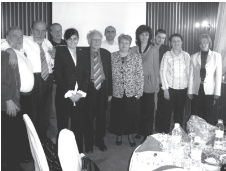
Георги Милев на 80 години

По-късно, на един пленум на Републиканския младежки съюз, самият Тодор Живков каза: "Този перничанин трябва да го пратим да учи, в него има бъдеще!"