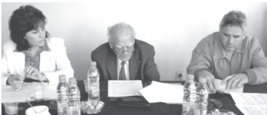
Заседание на Управителния съвет на СВИКБ