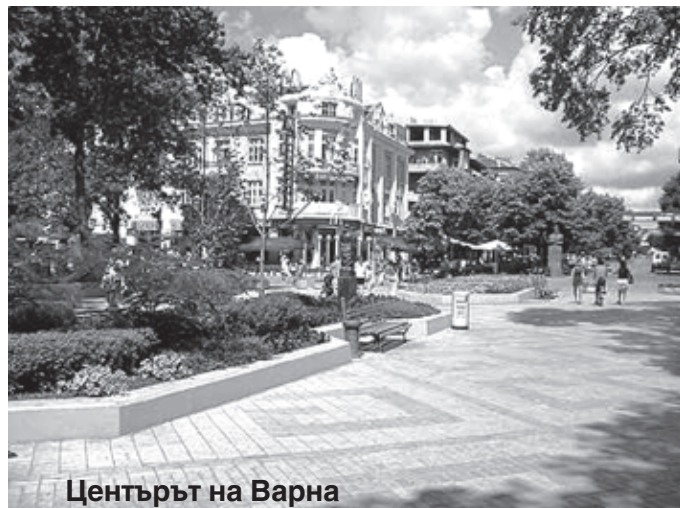
Центърът на Варна

Димитър КОСТОВ, кореспондент за Варна и областта