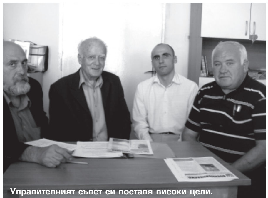
Управителният съвет си поставя високи цели.