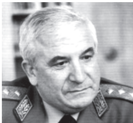
Генерал-полковник Цветан Тотомиров

Но трябва ли сега да хвърлим всички упреци за липсващите качества у съвременния млад българин само върху отсъстващата казарма? Докато съществуваше, тя успяваше да навакса част от пропуснатото в семейството и в училището. Но не бе панацея за обществено развитие. Може би е ред-