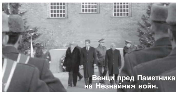
Венци пред Паметника на Незнайния воин.